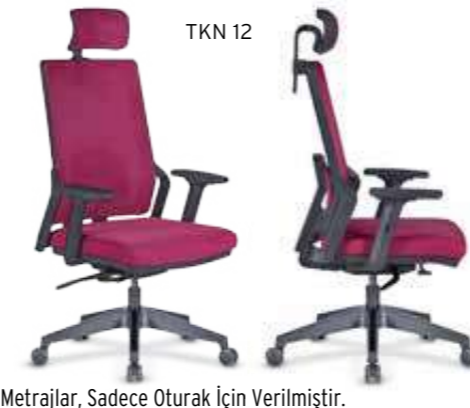
Metrajlar, Sadece Oturak İçin Verilmiştir.