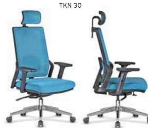
Metrajlar, Sadece Oturak İçin Verilmiştir.