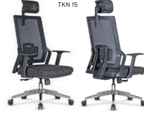
Metrajlar, Sadece Oturak İçin Verilmiştir.