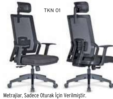
Metrajlar, Sadece Oturak İçin Verilmiştir.